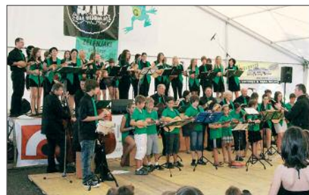
ZELENJAKI - Geritshof/Kroatisch Gereshdorf