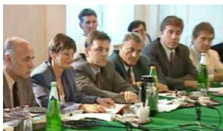
Prva, konstituirajuća sjednica Savjeta za hrvatsku narodnu grupu 3. augusta 1993. ljeta u Saveznom kancelarstvu u Beču.

Nakladnik i vlasnik medija: Hrvatsko kulturno društvo u Gradišću (Kroatischer Kulturverein im Burgenland); glavni sastavljač broja: Matthias Wagner; izdavač: odbor HKD-a; svi: Ulica dr. Lovre Karall-a 23, 7000 Željezno/Eisenstadt; tisak: Wograndl, Mattersburg/Matrštof. Izdavanje Glasila podupira Savezno kancelarstvo iz lonca za narodne grupe. Gefördert vom BKA aus Mitteln der Volksgruppenförderung.