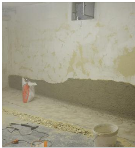
Potrebno saniranje društvenoga doma u Karallovj ulici u Željeznu