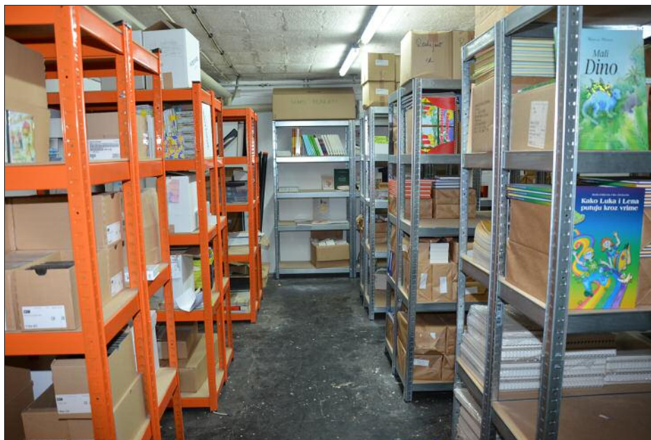
Novo uređeno skladišće za različna izdavanja Hrvatskoga kulturnoga društva u pivnici društvenoga doma u Željeznu