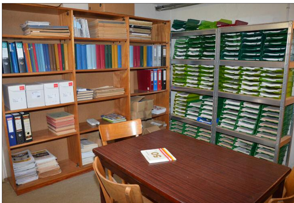
Novo uređeni arhiv Hrvatskoga kulturnoga društva u saniranoj pivnici

Iz financijskoga pogleda bi sigurno bilo bolje, ako bi HKD napravio već komer-