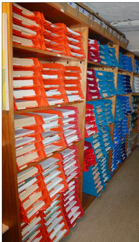
HKD je za hrvatske kazališne grupe stvorio Dramoteku, u koj si one moru pogledati i posuditi kazališne kusiće